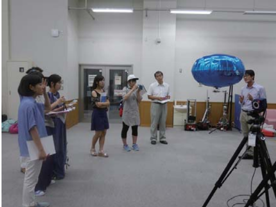
飛行ロボットの説明を受ける西条高校の皆さん

2017年8月9日に、愛媛県立西条高校のみなさんが柏キャンパスに見学にお見えになりました。人工物工学研究センターでは、太田研究室の移動ロボットや看護教育用患者ロボット等について紹介を行いました。