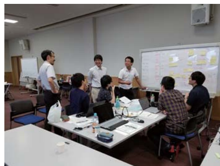
プロジェクト型学習の様子

各班から多彩な提案がなされるとともに、より学習の効果を高めるために、各グループに対して、教員からのコメントと他のグループからのコメントが返され、さらに、学生自身による振り返り活動が実施されました。これらにおいても、RACE の考え方を軸にして行われ、構成型工学の理解促進が図られました。