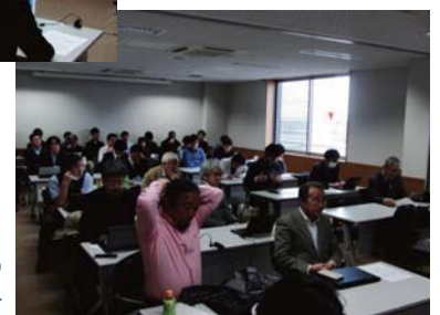
コロキウムの会場の様子