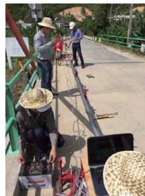
橋の凹凸を計測している様子