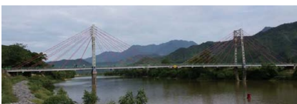
凹凸を計測した Pho Nam 橋